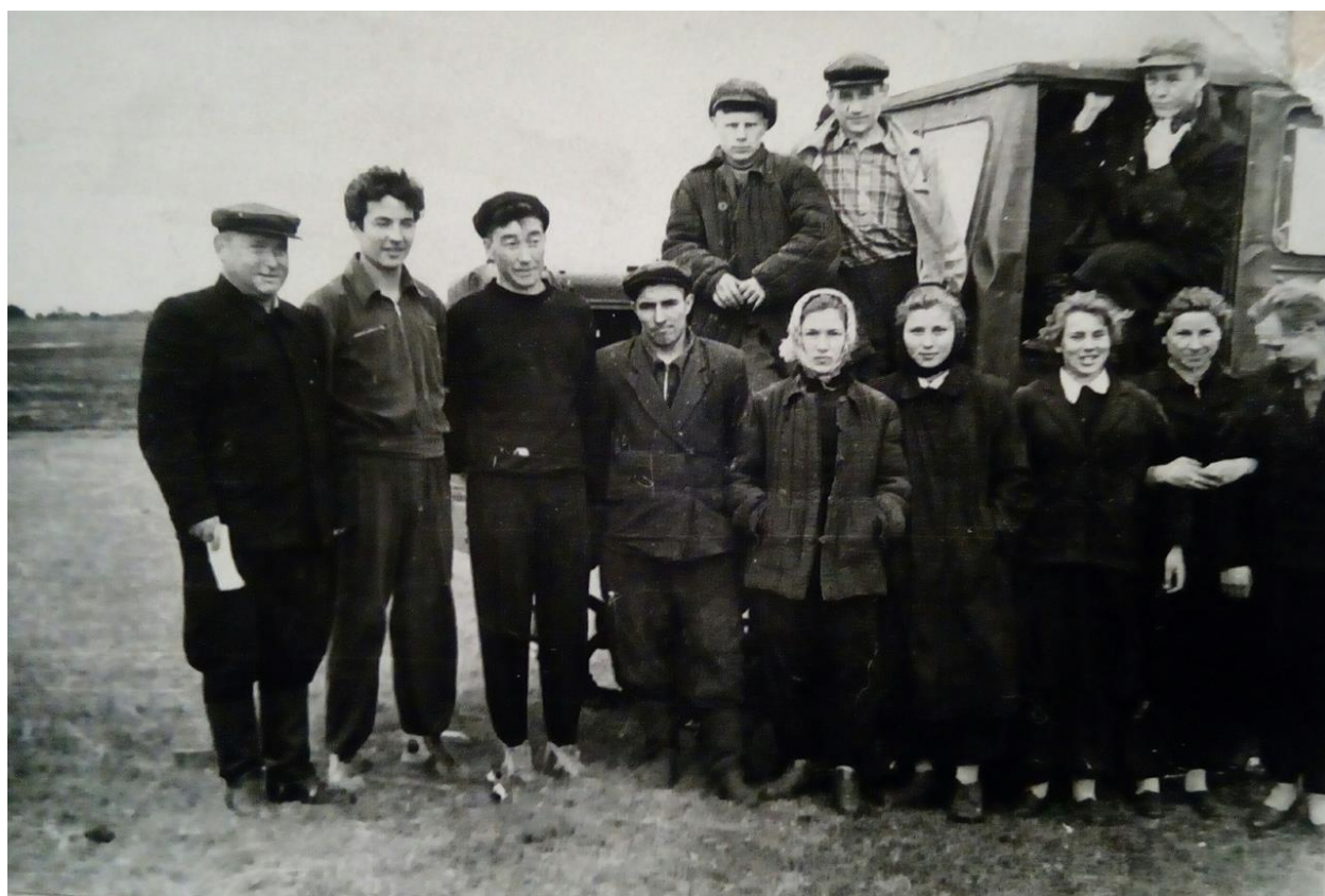
Практические занятия по машиноведению