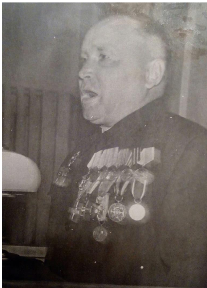
На одном из выступлений