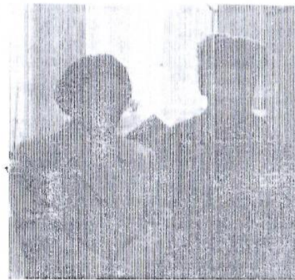
///Аларь. — 1994. — 13 окт.