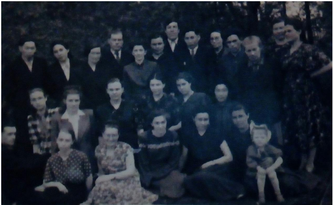
Коллектив учителей Кутуликской восьмилетней школы

Г. Долина, „По заветам Ленина“, 16 апреля 1975 г., № 46 .