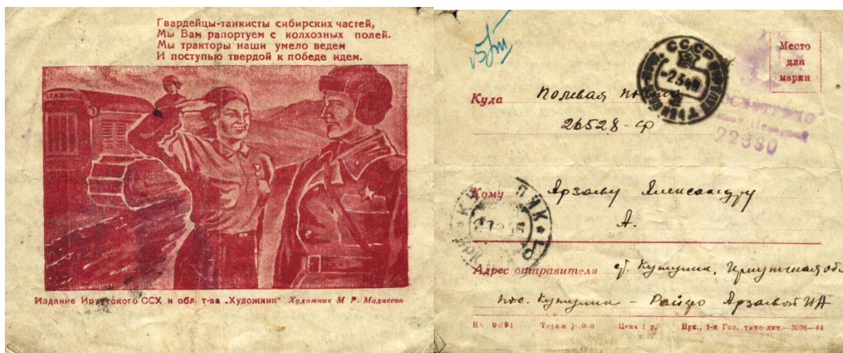
Письмо-открытка на фронт. 26 февраля 1945 г.