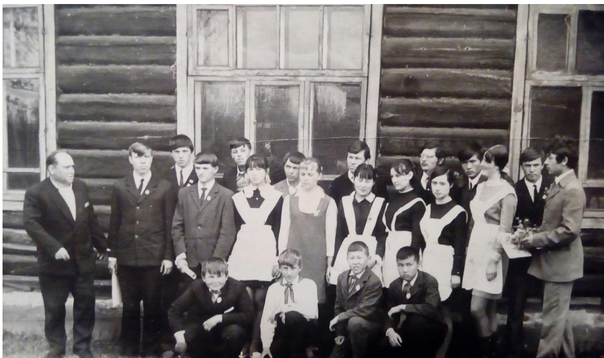
Обладатели значков «Готов к защите родины» и «Гражданской Обороне»