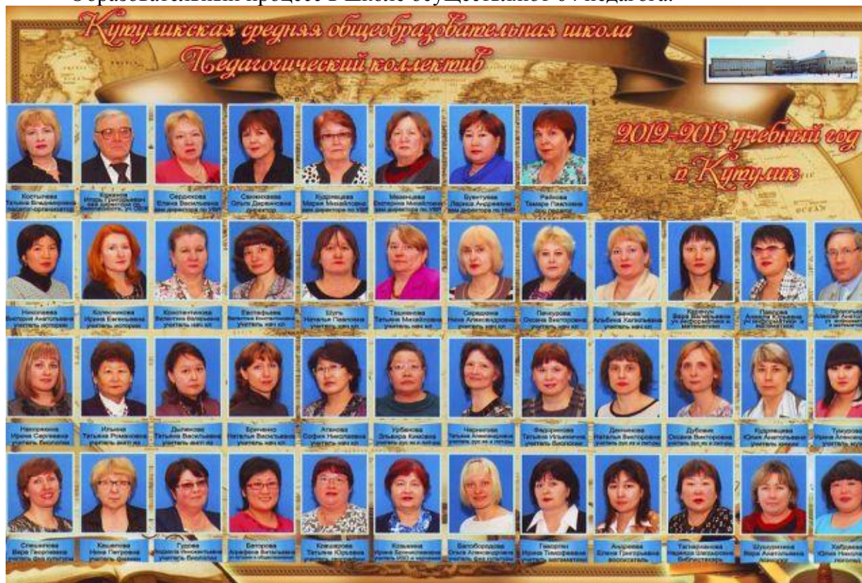
Качественная характеристика педагогического коллектива.

Образовательный процесс в школе осуществляют 64 педагога: